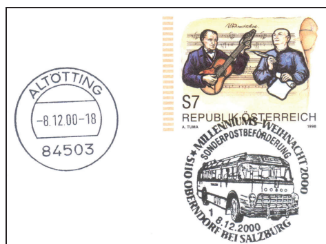
Sonderpostbeförderung per Postbus über die Grenze nach Deutschland

Bei Sonderpostbeförderungen kann es sein, dass nur Umschläge oder Karten transportiert werden, die vom Veranstalter verkauft werden.