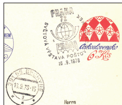
Ballonpost in der Tschechoslowakei