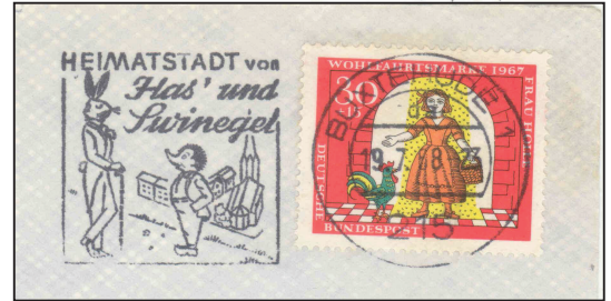
Ortswerbbestempel Thema Geschichten (Fabeln)

Nachdem im Blatt Nr. 33 schon erklärt wurde, wie wir zu Briefmarken und Ganzstücken sowie zu den notwendigen Erklärungen kommen, soll hier besprochen werden, wie abwechslungsreich wir eine Sammlung gestalten können. In der Jugendgruppe oder beim Lesen der Zeitschrift „Die Briefmarke“ wird so mancher bereits verstanden haben, dass wir alles sammeln, was mit dem Briefpostverkehr zu tun hat.