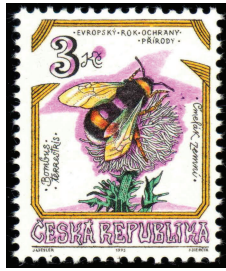
Sondermarke Thema Bienen u. Verwandte