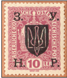
Dauermarke Thema Wappen