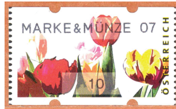
Automatenmarke Thema Gartenblumen