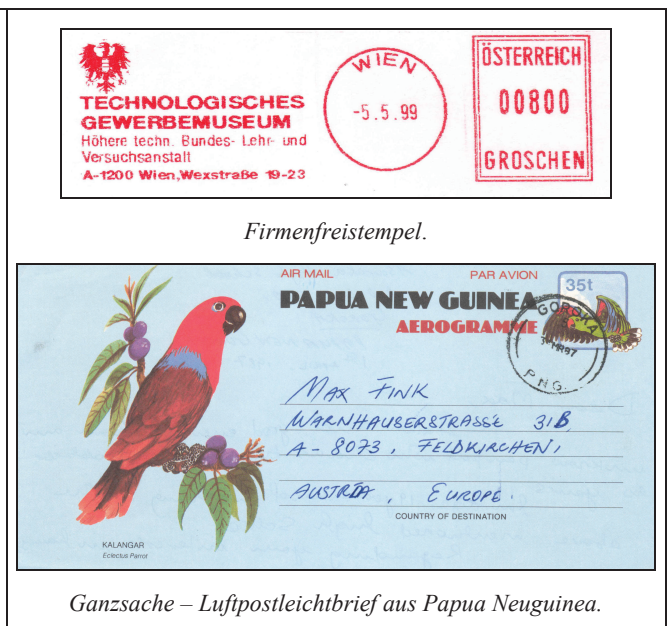
Ganzsache – Luftpostleichtbrief aus Papua Neuguinea.